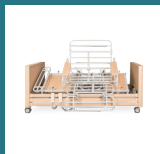
Freedom Easy Up