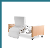
Freedom Deluxe Low