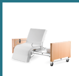
Freedom Basic Low